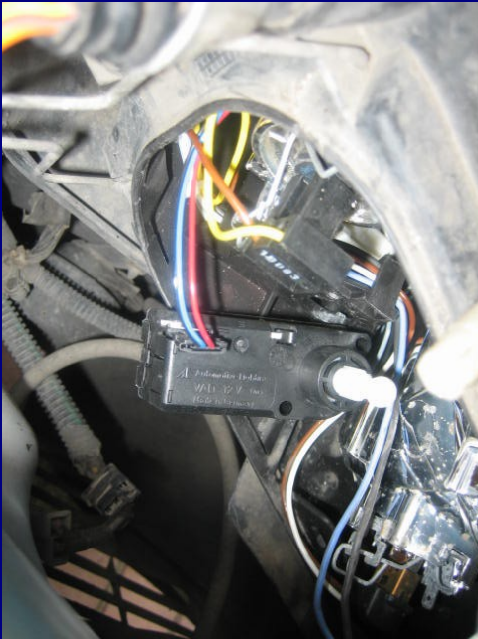
zainstalowałem nowy silniczek 🤔